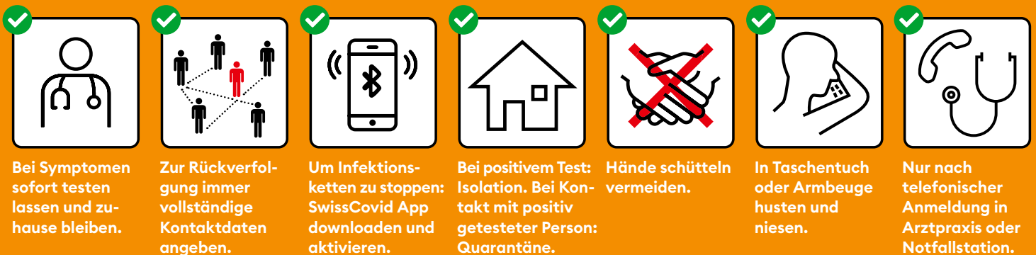
Bei Symptomen sofort testen lassen und zu- hause bleiben.